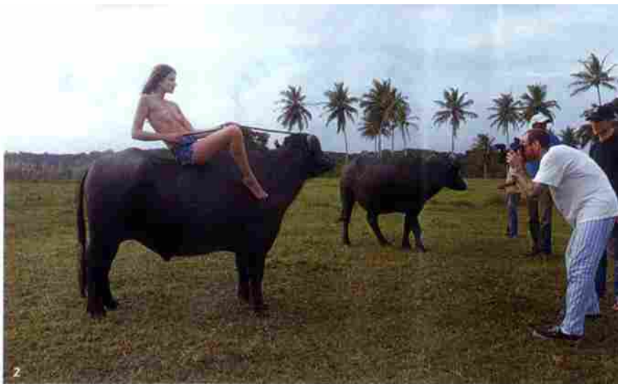
1 e 2. Eniko Mihalik, 21 anni, ungherese. 3. Lily Cole, 21, inglese. 4. Ana Beatriz Barros, 27, brasiliana. 5. Daisy Lowe, 20, inglese. 6. Marloes Horst, 20, olandese. 7. Rosie Huntington. 8. Uno scatto nei fanghi. 9. Abbey Lee Kershaw, 22, australiana. 10. Miranda Kerr, 26, australiana, fidanzata di Orlando Bloom.